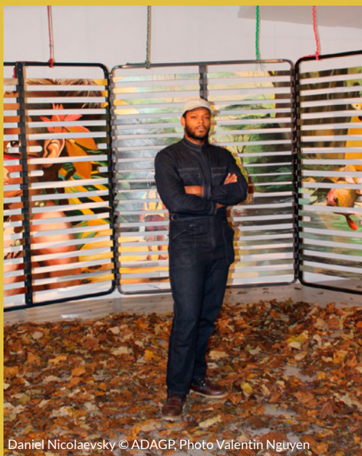
Daniel Nicolaevsky © ADAGP, Photo Valentin Nguyen

Ses interventions dans l'espace public transforment le paysage en une « matière relationnelle », où l'art devient un vecteur de rencontre et de réappropriation symbolique pour les communautés marginalisées ou isolées.