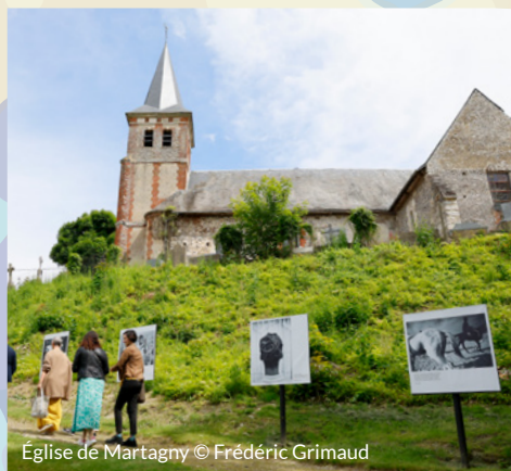
Église de Martagny