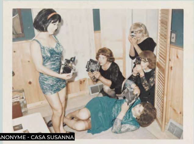
ANONYME - CASA SUSANNA

Il écrase tout sur son passage. Tant en termes de fréquentation et de budget, que de programme. Pour la 55 e édition, le festival arlésien propose une pause de qualité dans un monde saturé d'images. Impossible de faire le tour des expositions pensées sous la direction de Christoph Wiesner et Aurélie de Lanlay pour « Un état de conscience ». Se démarque cependant un véritable hommage au cinéma. De films en images convoque les ambiances tourmentées de Gregory Crewdson, les images fixes et animées d'Agnès Varda, le journal de bord Polaroid de Wim Wenders, ainsi qu'une intrusion dans l'imaginaire des cinéastes via leurs Scrapbooks . Immanquables aussi, la rétrospective Saul Leiter, un bout d'histoire LGBTQIA+ avec les Polaroids de Casa Susanna, et la féministe Søsterskap qui convie dix-huit photographes nordiques parmi lesquelles Emma Sarpaniemi qui fait l'affiche avec son Autoportrait en Cindy (Sherman). Festival défricheur, encore et toujours ! Du 3 juillet au 24 septembre. Arles (13).